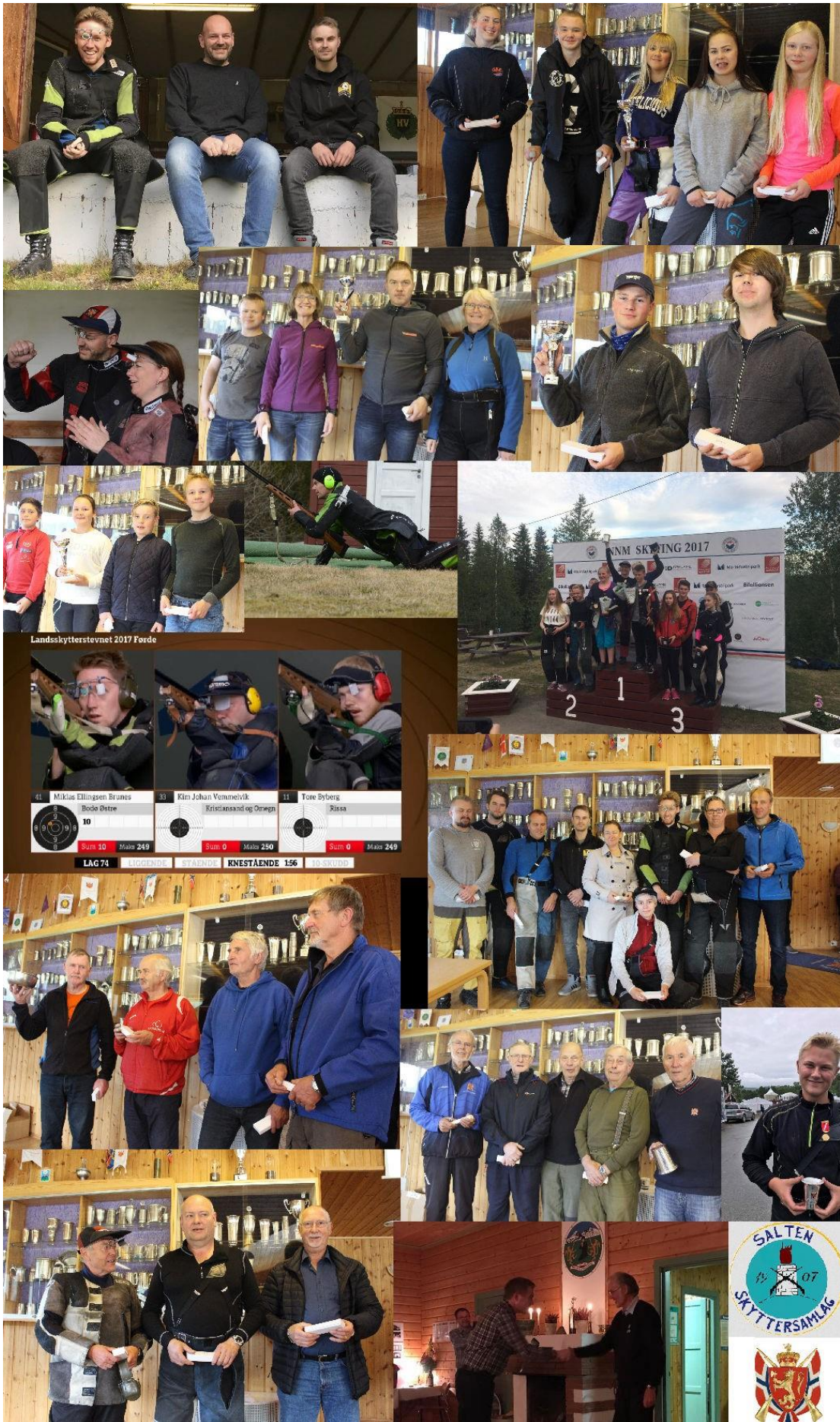
Landskytterstevnet 2017 Forde