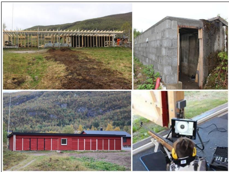
Ny Standplass, grav og elektronikk hos Ørnes skytterlag