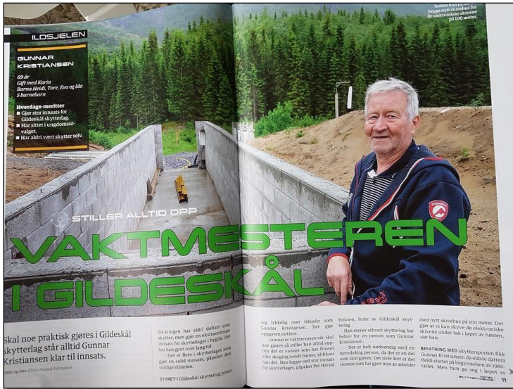
Utdrag fra Norsk skyttertidende. Bygging av «garasje» til skivene på 100m i Gildeskål.