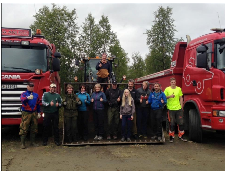
Dugnadsgjengen i Sulitjelma